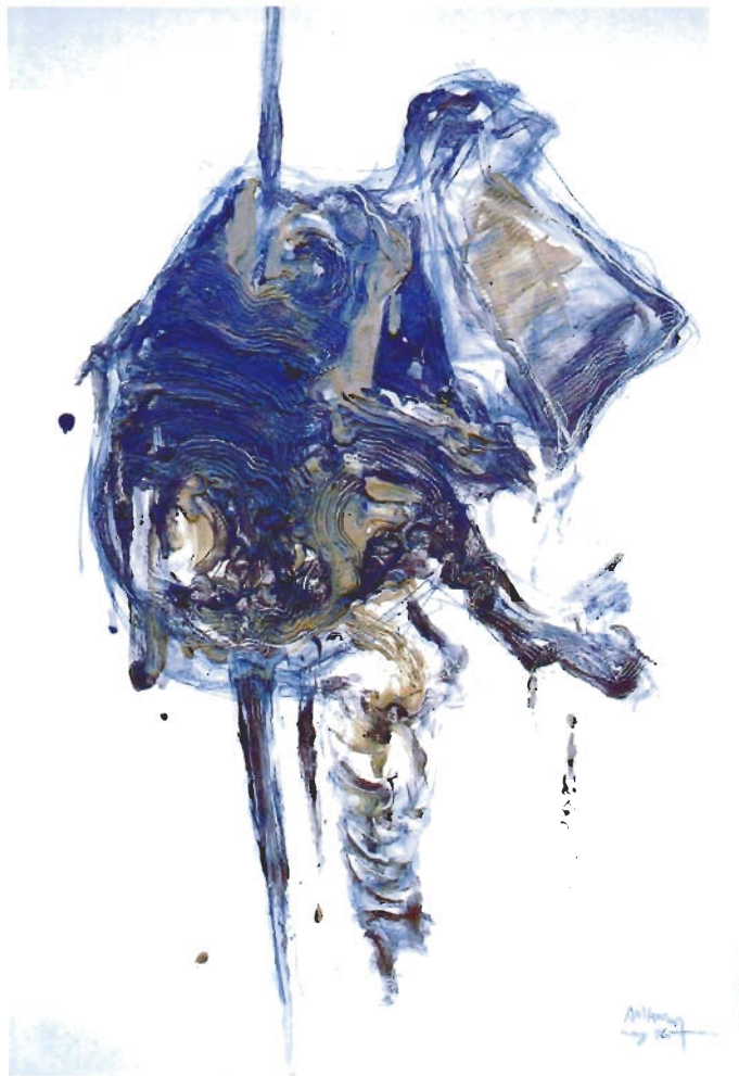
Forma I (1996) 115 x 195 cm Tècnica mixta sobre tela