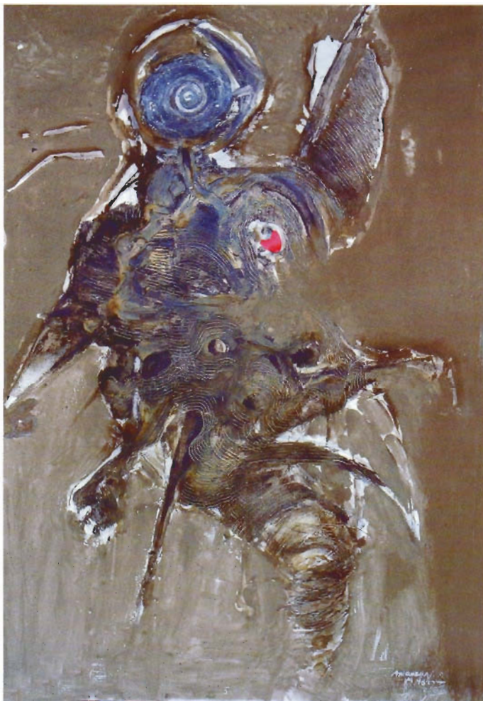
Ciclop ballant (1996) 115 x 195 cm Tècnica mixta sobre tela